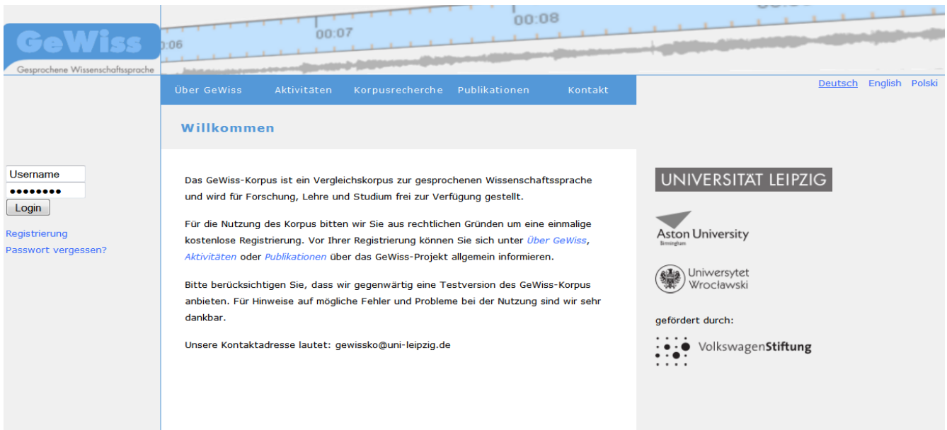
Abb. 3 Startseite des GeWiss-Korpus

Tragen Sie in der anschließend erscheinenden Registrierungsmaske Ihre Daten ein. Nach Zustimmung zu den Nutzungsbedingungen und Kenntnisnahme der Datenschutzerklärung können Sie sich durch Anklicken der Schaltfläche Senden registrieren. Nach dem Senden Ihrer Daten erhalten Sie an die von Ihnen angegebene E-Mail-Adresse eine Kontakt-Mail. Nach Bestätigung dieser Mail werden Ihnen die Zugangsdaten an Ihre E-Mail-Adresse zugeschickt.